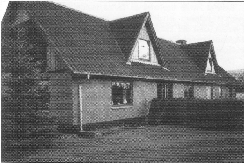
Norden Voldbrogård, Torngaardsvej 106.