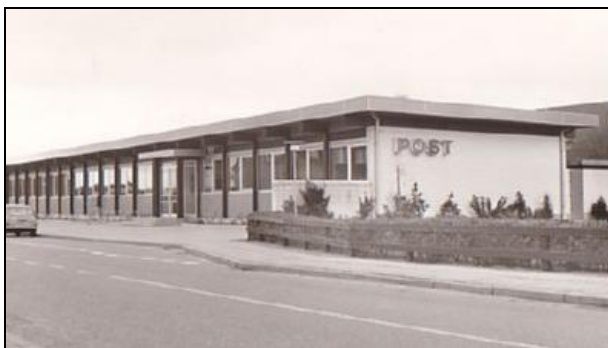
I 1971 indviedes Aabybros sidste postkontor (Rolighedsvej 2).

Det skal til sidst nævnes, at postkontoret i Aabybro blev nedlagt for flere år siden, og postekspedition og kundebetjening foregår i en postbutik, som har til huse i et hjørne af en af byens dagligvarebutikker.