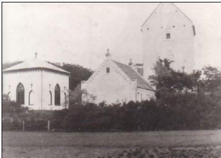
Aaby Kirke ca. 1920 set fra vest, før kirkens eget kapel blev fjernet.