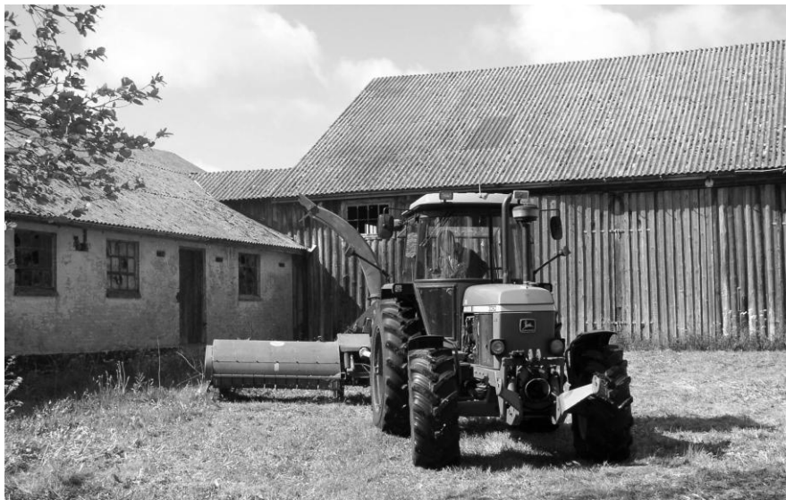
Fra gård 18 nuværende Vildmoseporten, før renoveringen gik i gang

”Centralgården” hedder stedet dog stadig i folkemunde, og bygningens udseende er ikke ændret væsentligt. Lokalteterne er skjult af træer og fremstår derfor ikke længere så markant i landskabet som tidligere.