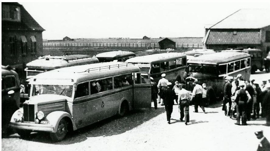
Centralgården som "turistattraktion" lige efter krigen

Centralgården var i de første år efter opførelsen som opdrætningscentral et meget populært og søgt udflugtsmål for hele landets landboere og blev i 1940'erne kendt over det ganske land.