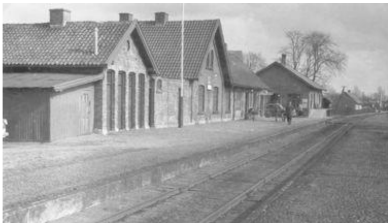
Aabybro Station 1969

På næste station oplyses det, at ”Stationsbygningen præsenterer sig anselig og elegant”. Det er ikke så sært – for den medbragte rugbrødsmotor har drevet køretøjet frem til Aaby Station. Journalisten spekulerer over, at ”der her maaske engang kan blive noget stort”, men ellers er han meget skeptisk med hensyn til Aaby, som han mener ”for tiden ligger og ved ikke rigtigt, hvad den vil”. Byen er delt i 2, for ”oppe ved Kirken ligger den oprindelige By og smuldrer bort og bliver mindre og mindre”. Det er skidt – og det er ikke stort bedre med kroen, som ”ligger nede i Krogen ved Landevejen og Ry Aa”, og som engang ”havde en anselig Kjøbmandsforretning som Nabo”. Men byens vise fædre (de skarn) besluttede, at ”Posthuset skulle bygges en Fjerdingsvej borte fra Kroen, og her har man ogsaa placeret Stationen, der har fået navnet Aabybro Station, skjønt den tager mægtig afstand fra Broen”.