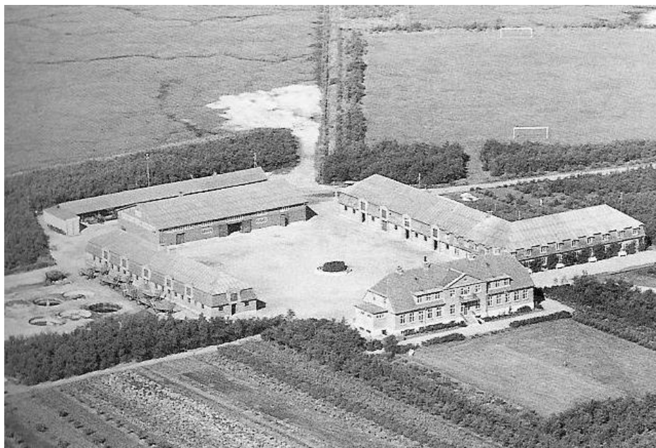
Centralgården og dens driftsbygninger set fra luften