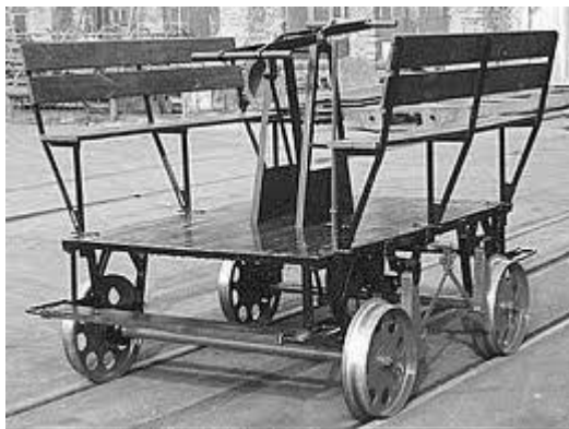
”Dræsine” et køretøj til jernbanens reparatører

Som overskriften antyder, måtte journalisten foretage turen på en draisine, da der ikke var et lokomotiv til rådighed. Læserne orienteres indgående om, hvilket slags køretøj en draisine er. Det oplyses, at ”den nærmest er at ligne ved et Vaskebræt på fire Jernbanehjul” og at den bevæges fremad ved ”Kraften af både Hænder og Fødder, idet man bevæger sig nærmest som ved Kaproning”.