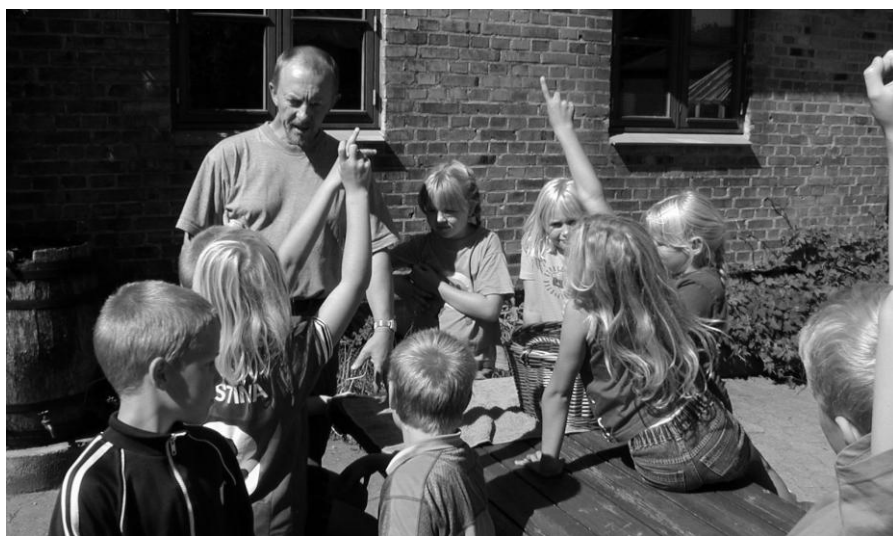
Skolebørn på naturskolen

Udover at fungere som økologisk jordbrugsskole, lejede Aabybro Kommune den vestlige sidefløj, hvor i der i 1994 indrettedes natur-skole. Der blev ansat en naturvejleder, således at elever fra kommunens skoler kunne komme og gå på opdagelse i naturen – samtidig med at de blev undervist i flora og fauna. Det var også muligt at arrangere lejrskoleophold – altså med overnatning – og som sådan blev denne afdeling flittigt brugt af både elever, som kom for at gå på opdagelse i mosens særlige natur – og af kommunens andre ansatte, f.eks. lærere, når arbejdet i det kommende skoleår skulle planlægges.