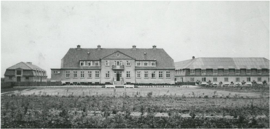
Centralgården set fra vejen, før bevoksningen skjuler bygningerne

I 1970 ophørte Statens forpagtning til planteavlsvforsøg, hvorefter Centralgården med 45 ha jord blev solgt til Aabybro Realskole, der på det tidspunkt var omdannet fra privat realskole til selvejende institution. Værelserne i hovedbygningen skulle benyttes til kostskoleelever. I en periode tilbød Realskolen ophold for børn og unge med adfærdsvanskeligheder fra Københavns Kommune. Elevtallet faldt imidlertid uventet hurtigt i de kommende år, hvorefter gården i 1976 overtages af Aabybro Kommune i forbindelse med, at kommunen overtager den selvejende institution Aabybro Kost- og Realskole.