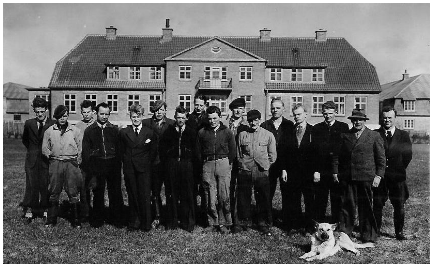
Fodermestre på Centralgården 1942-43

Der blev bl.a. udført forsøgsarbejde med både med kartofler og korn. En ekstra og særlig opgave var daglige aflæsninger af temperatur, vind og nedbør for indberetning til DMI. Hver aften og i weekends skulle eleverne forestå aflæsningerne, hvilket ifølge en af de ansatte fra den tid nok ikke øgede pålideligheden i DMIs vejrmeldinger!