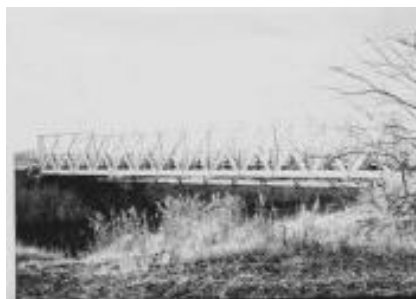
Jernbanebroen over Ryå

Birkelse Station og Arentsminde trinbræt får nogle ord med på vejen, men først rigtig interessant bliver det, da draisinen anløber Halvrimmen Station, for ”her mærkede man, at der var Damp oppe. Stationsbygningen var langt fra den eneste, der skabte Travlhed på Pladsen. Den ene Nybygning stod ved Siden af den anden og kappedes om, hvem der kunde blive først færdige”.