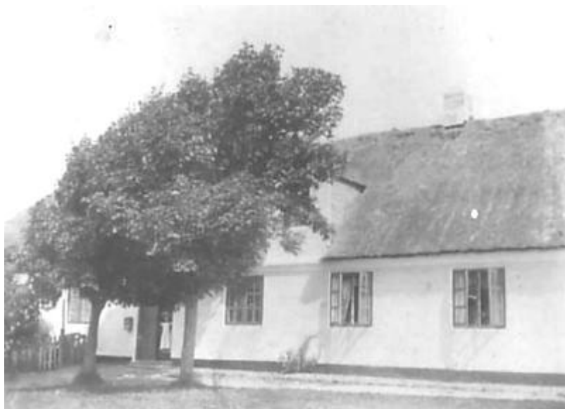
Aaby Nordre Skole