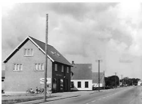
Rosenlund Brugsforening i Østergade