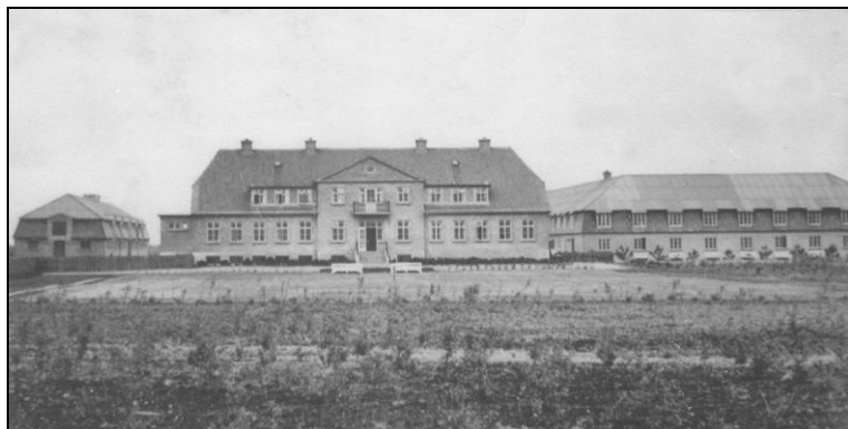
Centralgården der blev bygget i 1925 af Statens jordlovsudvalg