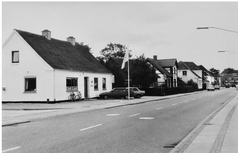
I forgrunden ses den gamle Frk. Heilmans Skole. De fire ejendomme mellem den gamle pogeskole og til nuværende Røde Korsbutik blev købt af kommunen med henblik på anlæggelsen af Torvealle og adgangen til rutebilstationen

som blev dagen, hvor det færdige arbejde skulle overdrages til kommunen og byens borgere. Elektricitetsværket havde sørget for at opsætte nye moderne elmaster af jern med gadelygter langs hele vejen, så den ny vej kunne fremstå rigtig flot og moderne. På indvielsesdagen skulle hele Kattedamsvej tilmed udsmykkes med en nyindkøbt flaggalle bekostet af beboerne. Borgerforeningen havde allerede i januar 1946 afholdt en bazar, hvis overskud skulle gå til indkøb af en flaggalle gennem byen. Basaren gav et overskud på kr. 3.000, men flagene lod vente på sig, og denne langsommelighed passede ikke beboerne langs Kattedamsvej, hvorefter de ved en husstandsindsamling skaffede penge til indkøb af 33 flag og flagstænger. Allerede ved anlæggelsen af fortovene havde man taget højde for dette og fået nedsat nogle metalrør til flagstængerne.