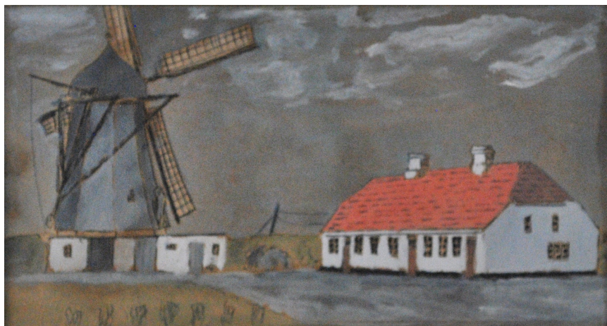
Øverst ses koloreret foto af Rosenlund Mølle, som blev nedlagt i 1954. Nederst ses maleri af Aaby Mølle på Kirkevej, som blev nedrevet i 1944. Selve Møllerhuset dog først i 2020. Se side 19. Se omtalen side 19