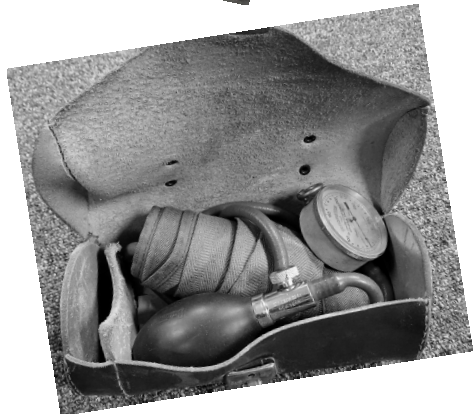
Højfrekvensapparat med instruktion Fødetang ved vanskelige fødsler Tænger til tandudtræk Gammelt blodtryksmåleapparat