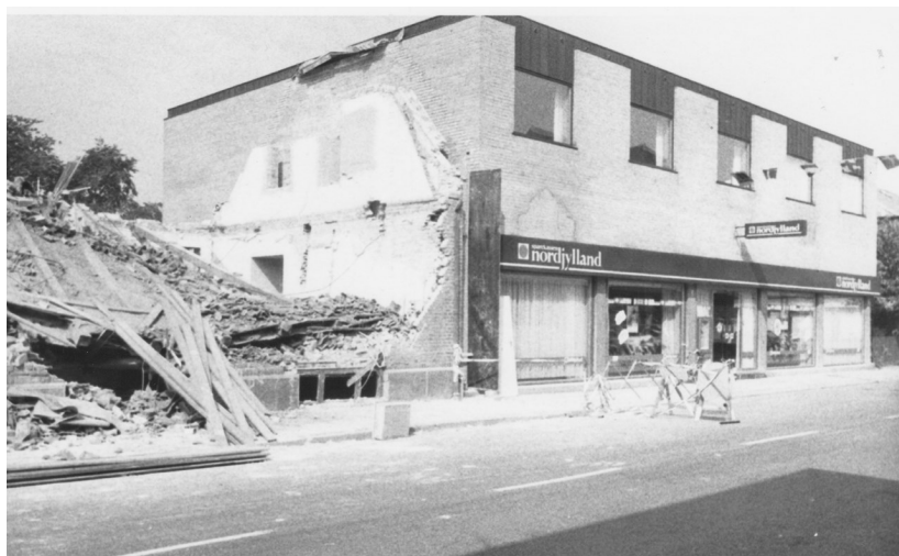
Sparekassen Nordjylland står der på facaden af første etape af den bygning folk kender. Sparekassen fra 1935 er revet ned - kun gavlen anes

nordjyske sparekasser samtidig med oprettelsen af et netværk af filialer i Aalborg. Stort er godt, sagde man, og den 1. januar 1971 blev Aaby-Biersted Sparekasse lagt sammen med Sparekassen Nordjylland, som de nu kaldte sig. Og så skulle der rages ned og bygges nyt. Tiden var til det!