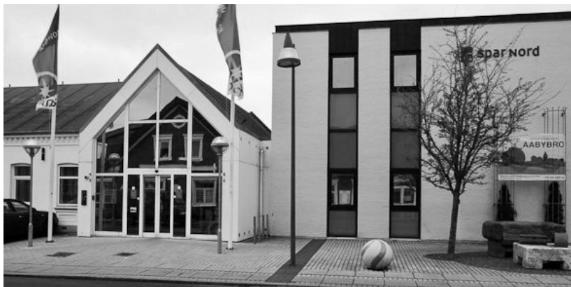
Den 18. december lukkede hæveautomaten i sparekassens vindfang, der samlede sparekassebygningen og kroens ældre bygning til en helhed.

der samlede bankbygningen og kroens ældre bygning til en helhed. Ved samme lejlighed blev kvistene på kroens tag sløjfet og hele bygningen blev malet hvid. De resterende 380 kvm blev senere løbende renoveret og udlagt som 4 lejemål med fællesfaciliteter i form af køkken, kantine- og møderum samt toiletter. Den gamle krohave blev sløjfet og indrettet til p-plads, ligesom der blev lavet parkeringsmulighed lige uden for bygningen. Hele projektet blev færdig i 1992 og indeholdt fra starten bl.a. byens "Jobcenter", et lille bogforlag, som før holdt til på Kattedamsvej hos revisionsfirmaet Carl Sivesgaard. Ejendomsmægler Steen Vingaard og en fysioterapeut.