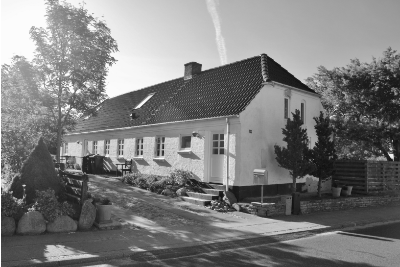
Møllerhuset - Kirkevej 10 - se også bagsiden af bladet

Først forsvandt møllen - Aaby Mølle på Kirkevej - og i 2020 forsvandt møllerhuset. Det karakteristiske, hvidkalkede hus med gavlen ud mod Kirkevej hørte til et af de kendte, gamle huse på Kirkevej i det, der engang blev benævnt Gl. Aaby.