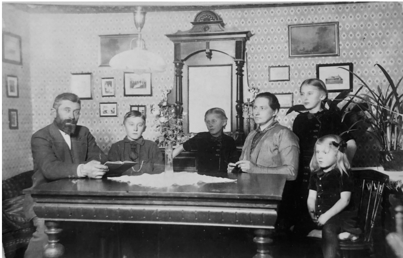
Møllerfamilien samlet i stuen i møllerhuset omkring 1916