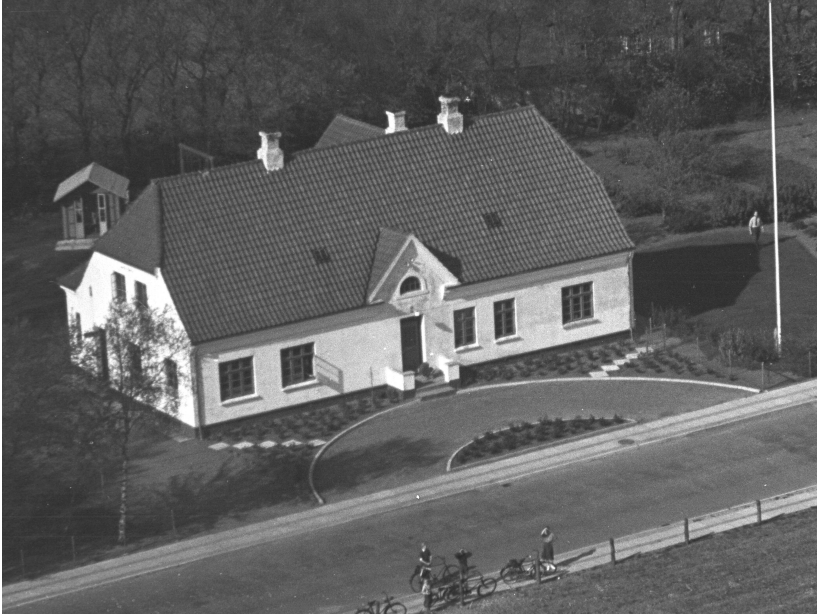
Aaby-Biersted Sparekasses bygning på Kattedamsvej 25 fra 1914-1935.

Billedet viser bygningen, som den så ud ca. 1950. I 1935 blev huset solgt til kommunen for kr. 16.000 og anvendt som kærnerkontor og bolig for kærneren. Helt frem til 1980 og selv efter det nybyggede rådhus - det senere bibliotek - blev bygget, blev huset brugt til Teknisk Forvaltning. Senest blev huset kendt som "Fritteren". Nedrevet i forbindelse med anlæggelsen af byggeriet "Bibliotekshaven"