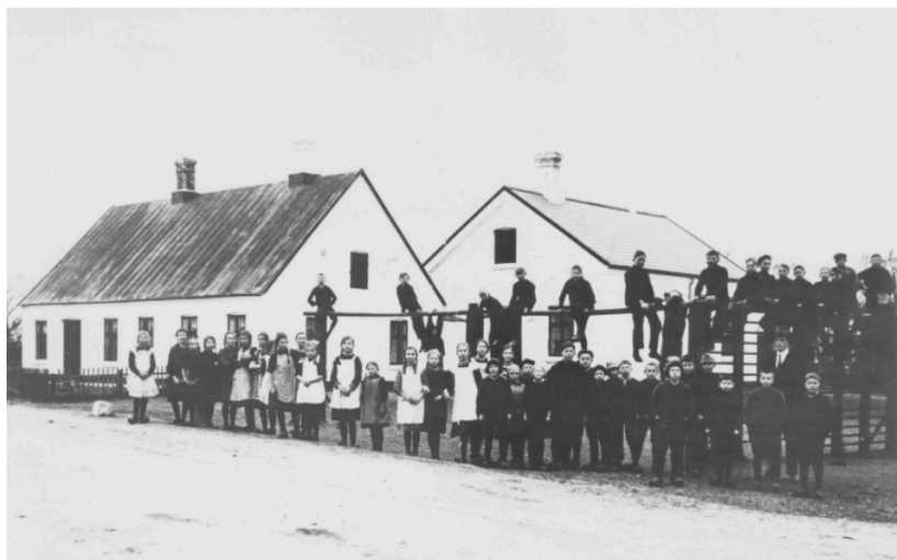
Aaby Søndre Skole i 1923