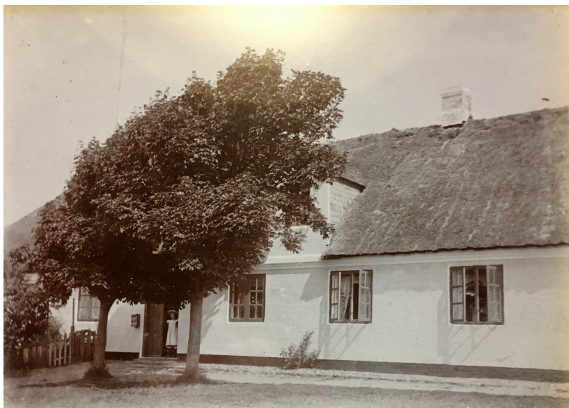
Nordre Skole med indgang til forskolens lokale, der var Sparekassens første lokale