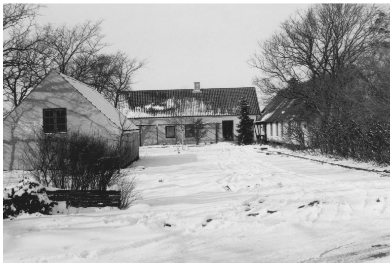
Øverst: Aaby Nordre Skole på Kirkevej. Nederst: Aaby Søndre Skole ved krydset Østergade-Toftevej