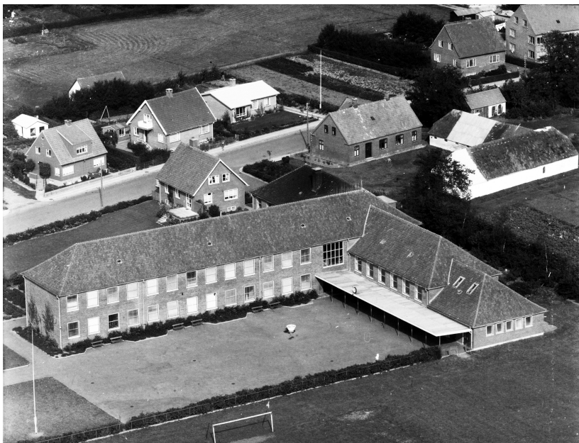
Aabybro Centralskole og førstelærerboligen i baggrunden

Det oplyses, at de samlede anlægsudgifter ville løbe op i svimlende 51 mio. kr. – og svimmelheden forstår man måske bedre, når man via forbrugerprisindekset i Danmarks Statistik omregner tallet til 2021 værdi, som lyder på hele 781 mio. kr...!