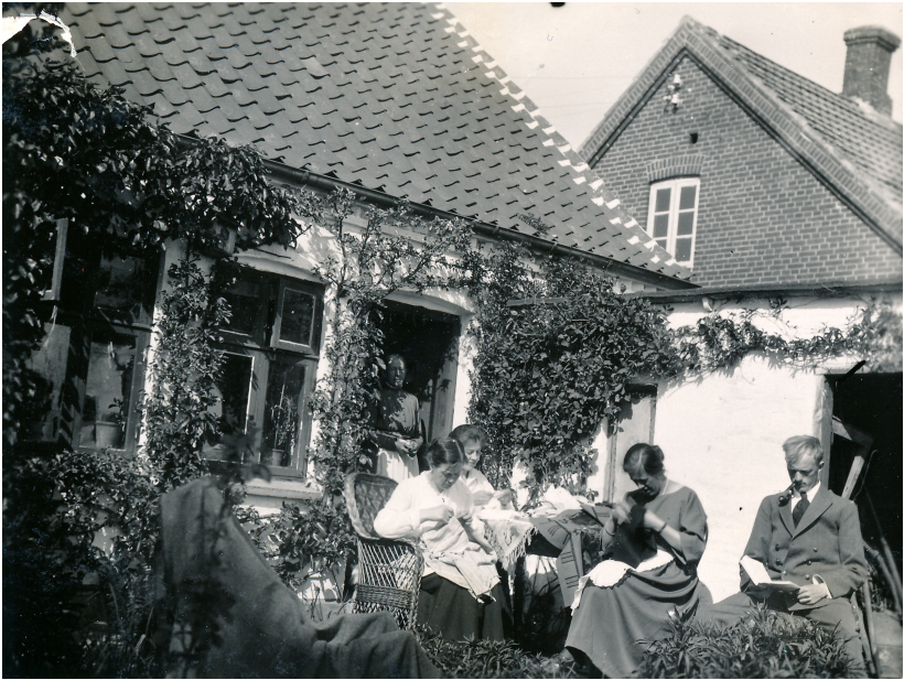
Fru Schou i døren, der kigger på sine børn & svigersøn i sin dejlige have